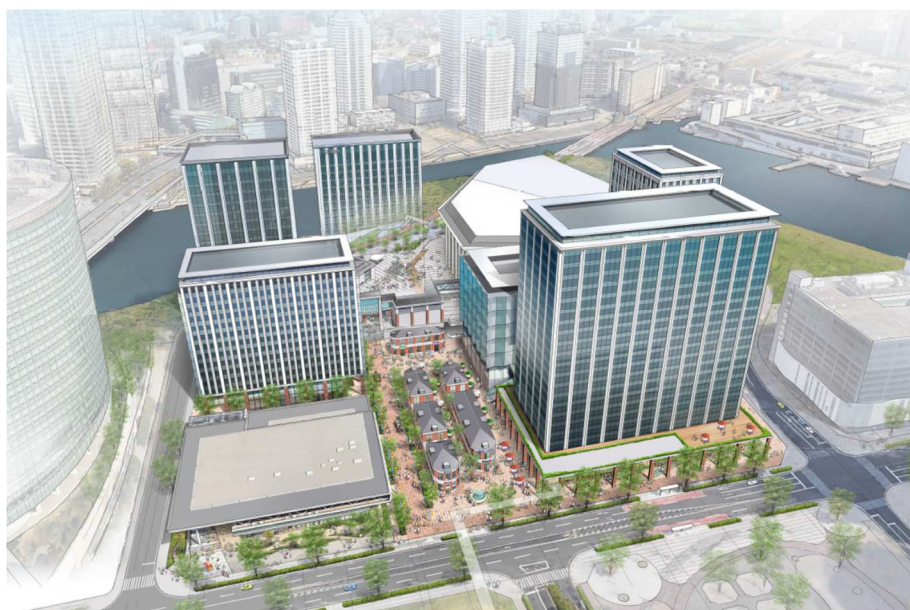
「みなとみらい21 中央地区60・61街区」 開発事業計画の完成イメージ

当街区は、Kアリーナ横浜を擁するミュージックテラス（株式会社ケン・コーポレーションによる開発）に隣接した、約23,000㎡の敷地です。敷地を縦断する歩行者通路を中心に、西側に専門学校、東側に商業施設、ホテル、ミュージアム、オフィスなどからなる複合施設の建設を計画しています。また、歩行者通路に面して2つの広場空間を設け、ミュージックテラスと一体となったエリアマネジメントの実現を目指します。今後は、横浜市と開発に関する協議を進め、2029年の開業を予定しています。